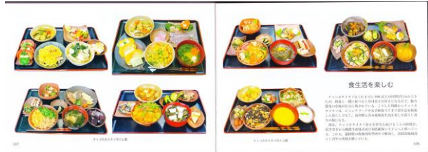
写真上/新しいチッコカタメタノ料理のレシピ集 下/チッコカタメタノ料理尽くし

また、11月18日(月)10時から13時に、プロジェクト鴨川味の方舟と千葉県酪農のさとが共催し、鴨川市ふれあいセンターでチッコカタメタノ料理教室が開催される。