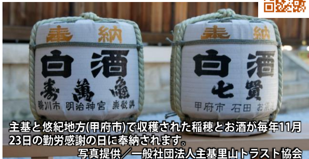
主基と悠紀地方(甲府市)で収穫された稲穂とお酒が毎年11月23日の勤労感謝の日に奉納されます。

鴨川で一番小さな公園、主基齋田址公園は皇室ゆかりの公園です。毎年恒例となった5月のお田植え祭りのあとは、8月中旬に刈り取りのお祭り「抜穂祭(ぬきほまつり)」が行われます。